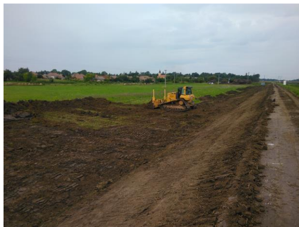
Töltésépítés a Csincse bal parton