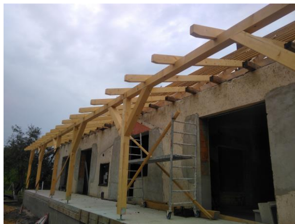
A fejlesztés keretében érintett Négyesi gátörtelep felújítása

A fejlesztések Négyes, Borsodivánka és Szentistván településeket érintik, ahol a töltésépítés megvalósulásával a védett ártéri öblözetekben csökken az elöntés kockázata. Ezzel együtt mérséklődnek a védekezési költségek, és nő az árvízi biztonság.